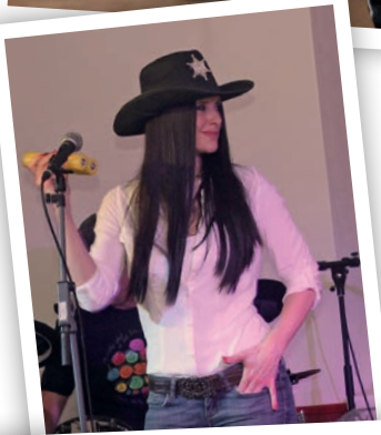
... A NAŠICH NEJVĚTŠÍCH