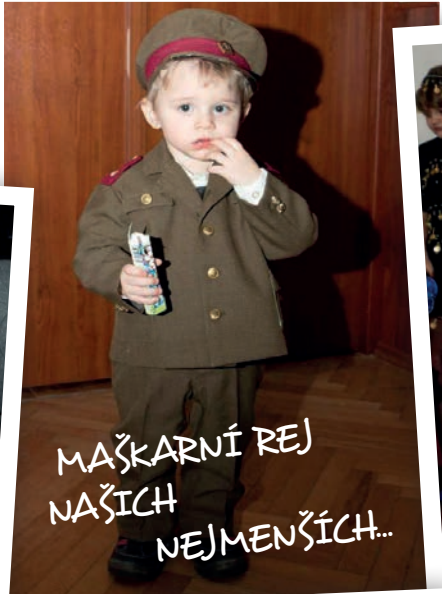
MAŠKARNÍ REJ NAŠICH NEJMENŠÍCH..